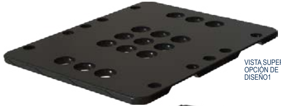
VISTA SUPERIOR OPCIÓN DE DISEÑO 1