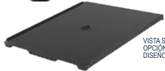
VISTA SUPERIOR OPCIÓN DE DISEÑO 2