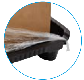
Muecas para Emplayado