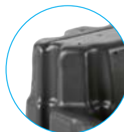
Característica para Rack