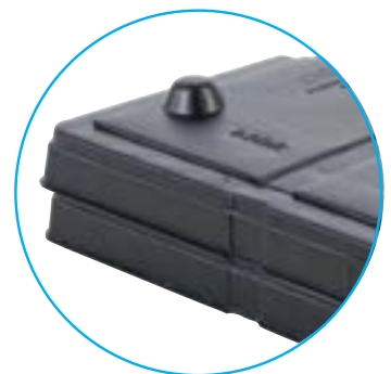
Diseño de Tapa Apilable Compatible con Banda Transportadora