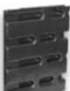
Termoformado de doble hoja