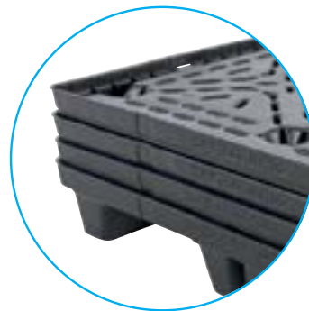
Diseño de Tarima Apilable Compatible con Banda Transportadora