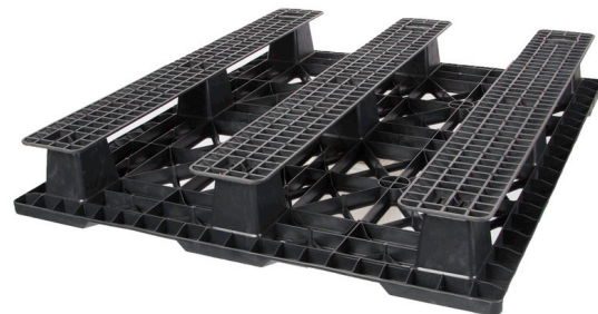
VISTA INFERIOR – CON CORREDORES