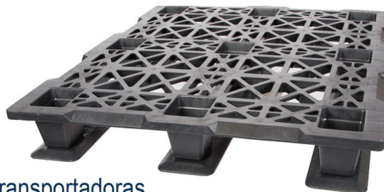
VISTA SUPERIOR – CON CORREDORES