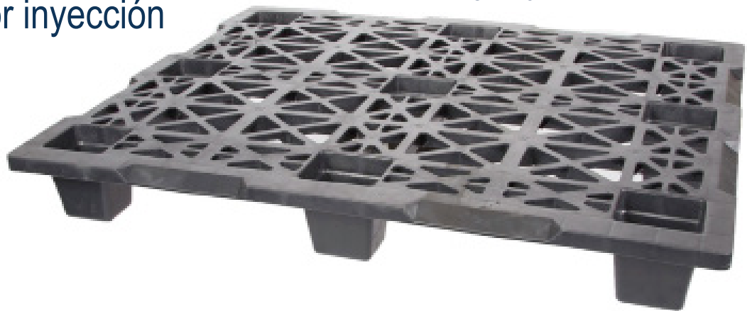
VISTA SUPERIOR – TARIMA ANIDABLE