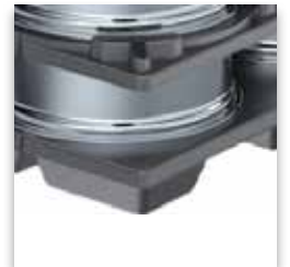
Base de Tarima con Anclaje Positivo