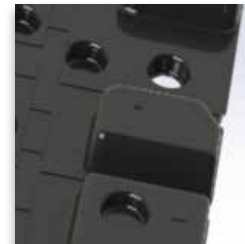
Orificios de Drenaje