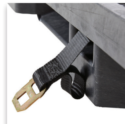
Correas de 2" / Lazos de fácil agarre de longitud mínima de 59"