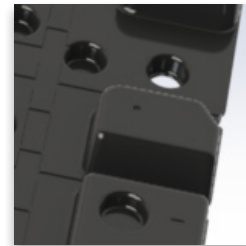
Orificios de Drenaje