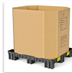
Asegura Caja Octagonal