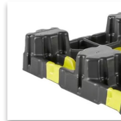
Característica para Rack